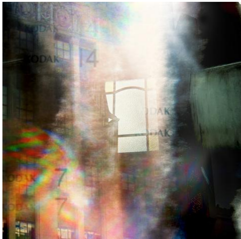
Stained glass spectrum / Lisa McCarty + Monika Radhoff-Troll, 2014